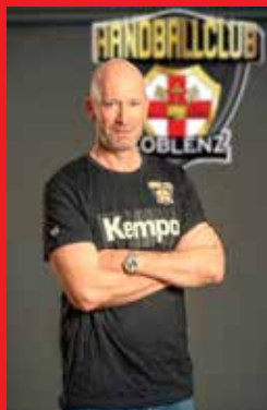
Leiter stell. Leiter