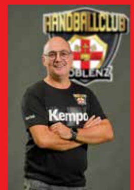
Sportlicher Obmann Leiter Spieltechnik Jugend Leiter Jugend Leiter 2 Abt. Leiter Moselw. Sponsoring & Marketing